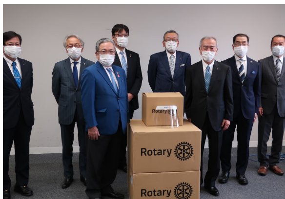
5/22 石川県へフェースシールド贈呈式

2日(火) 次年度理事会 11:30 9日(火) 6月定例理事会 例会終了後 23日(火) 最終夜間例会 点鐘 18:30 ホテル日航金沢 30日(火) 休 会